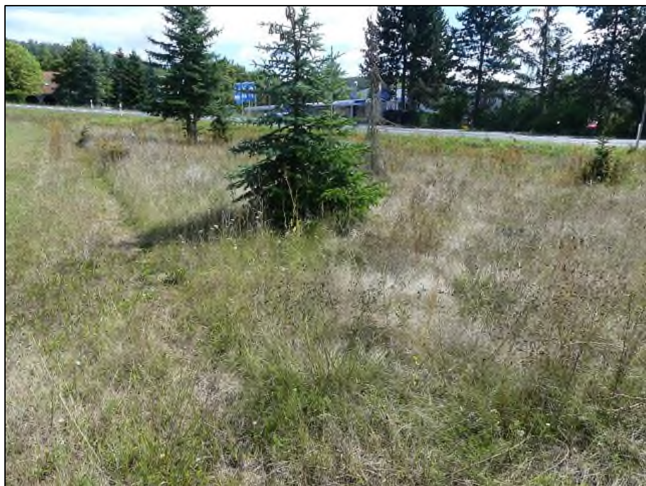
Abb. 6: Altgrasbestand mit kleinen Koniferen im Süden des Geltungsbereiches (18.08.20)