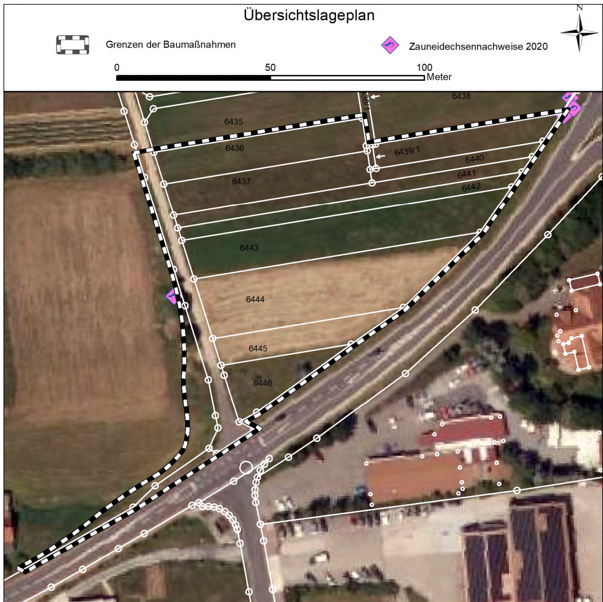
Abb. 2: Geltungsbereich und Nachweise der Zauneidechse 2020