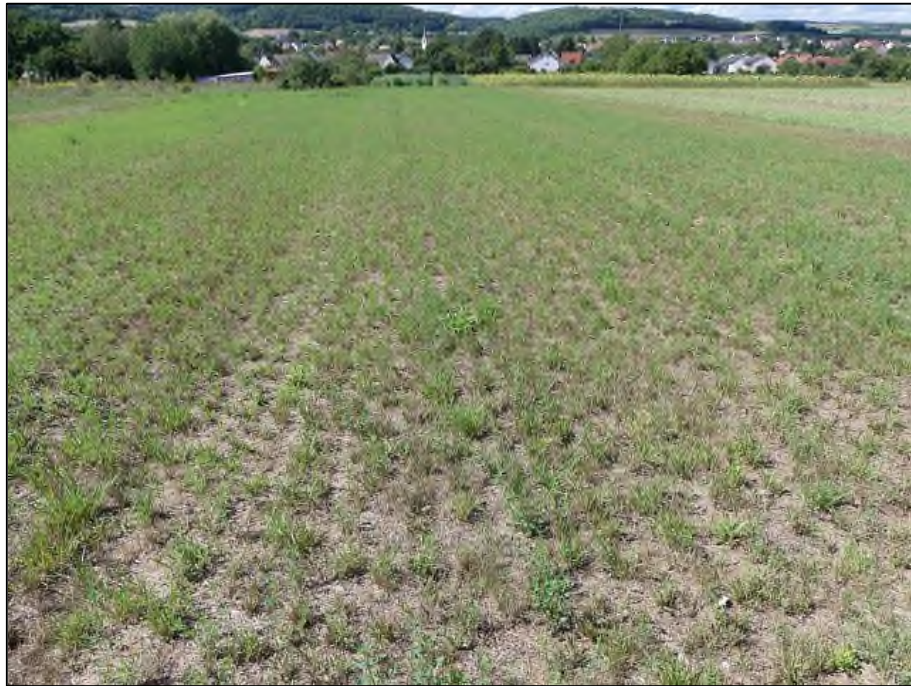
Abb. 5: Nördlicher Teil des Geltungsbereiches, Blick nach Westen (18.08.20)