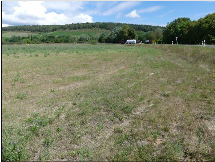
Abb. 3: Südteil des Geltungsbereiches, Blick nach Nordosten (18.08.20)