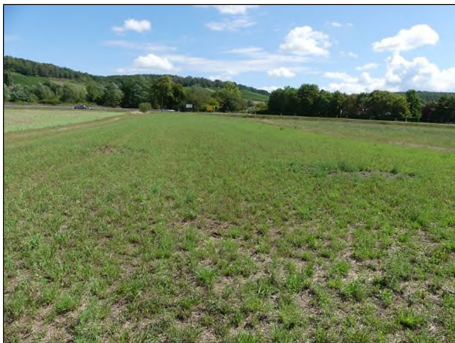
Abb. 4: Zentraler Teil des Geltungsbereiches, Blick nach Osten(18.08.20)